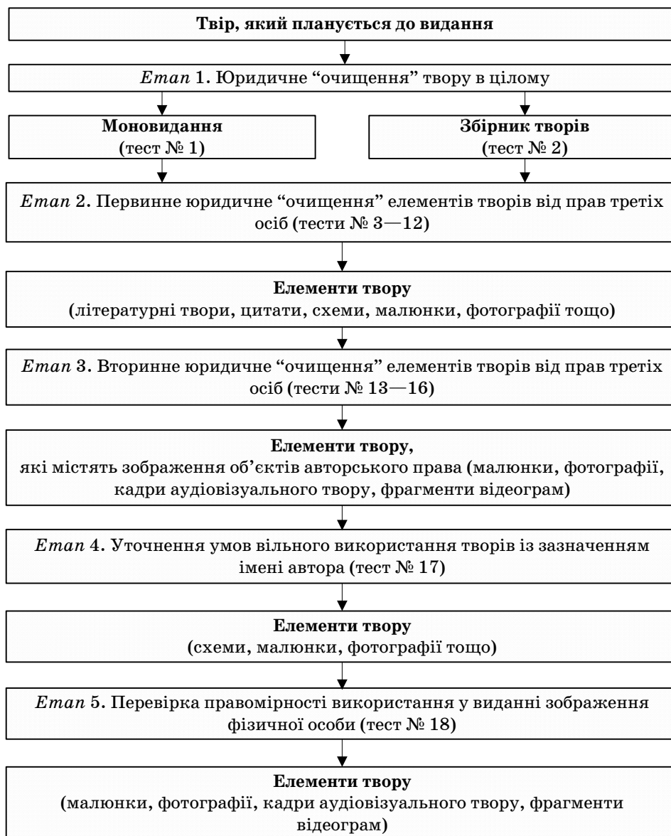
Рис. 1. Юридичне "очищення" творів від прав третіх осіб

Тест № 2 призначений для проведення юридичного "очищення" збірників творів.